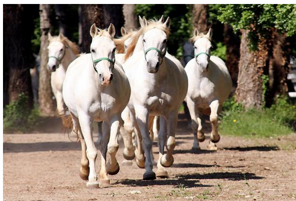
Domaine équestre de Lipica

Excursion à Lipica mondialement connue pour être le berceau des célèbres chevaux Lipizzans. Ces chevaux blancs majestueux sont élevés depuis plus de 400 ans dans le domaine équestre de Lipica. Visite du fameux haras. Dîner et nuit.