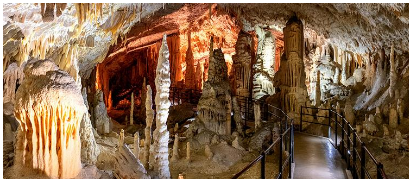
Grottes de Postojna

Visite de Škofja Loka , charmante ville au pied d'un château immense et son centre-ville médiéval au riche patrimoine artisanal. Départ pour Postojna. Déjeuner . Visite des grottes de Postojna , les plus impressionnantes d'Europe qui offrent un réseau souterrain complexe de passages, de salles et de formations rocheuses spectaculaires. On y admire les stalactites et les stalagmites éblouissantes qui ornent les parois de la grotte, créant une atmosphère magique. Dîner et nuit.