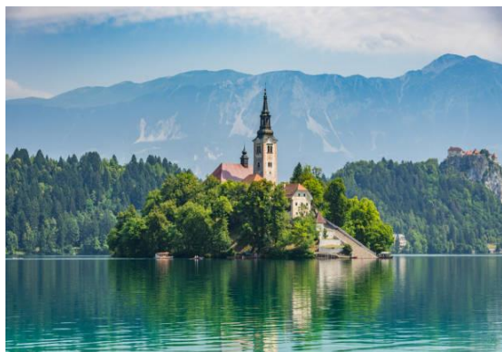
Lac de Bled

Visite de Bled , véritable paradis naturel d'une beauté époustouflante, situé au cœur des Alpes slovènes. Explorez son lac d'un bleu éclatant en embarquant sur les traditionnels bateaux « pletna » jusqu'à l'île de Bled. Visite de cette île pittoresque avec son église. Déjeuner . Excursion à Bohinj , situé dans le parc national Triglav ; Détendez-vous et admirez le paysage enchanteur au bord du lac de Bohinj, le joyau de la région aux eaux cristallines. Dîner et nuit.