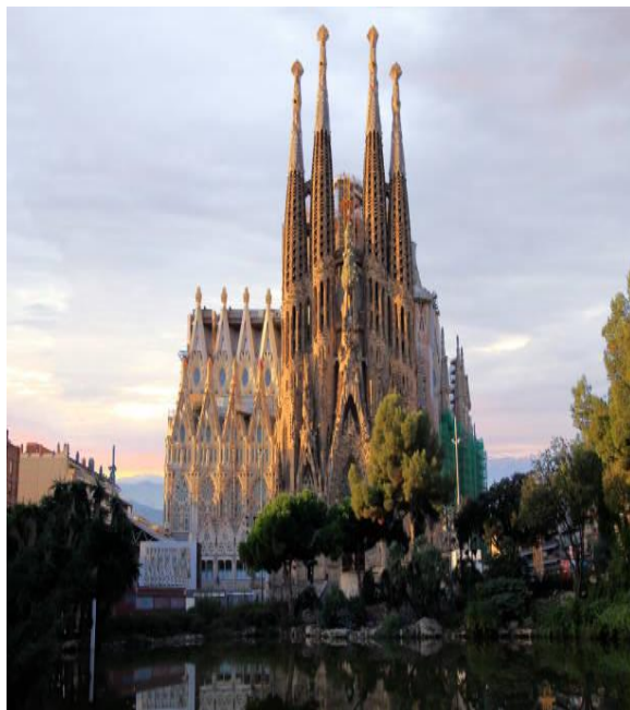
La Sagrada Familia

Pour ces sorties et ce voyage, inscriptions en fin de bulletin