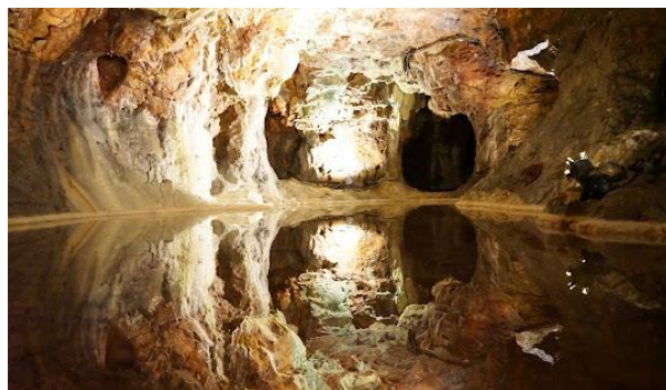
Les mines d'argent